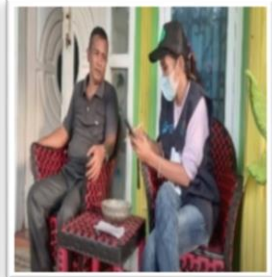
Uji Coba Wawancara Dengan Moda PAPI dan CAPI