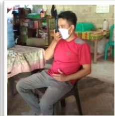
Pemanfaatan Kursi Lipat dan Handy Talky (HT)