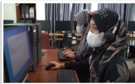
Uji Coba Wawancara Dengan Moda CATI

Multimode data collection yang diuji-coba mencakup penggunaan Paper And Pencil Interviewing (PAPI), Computer Assisted Personal Interviewing (CAPI), Computer Assisted Telephone Interviewing (CATI), Computer Aided Web Interviewing (CAWI), dan Drop Off and Pick Up (DOPU) oleh petugas.