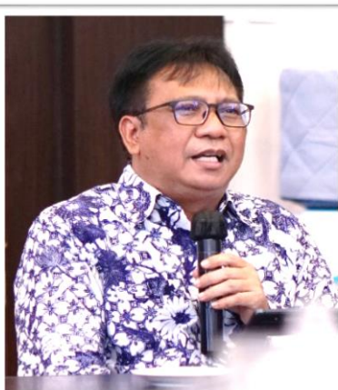
Kepala BPS, Margo Yuwono

Berdasarkan surat Kementerian Keuangan Nomor S-835/MK.02/2021 tanggal 17 September 2021 serta hasil Rapat Dengar Pendapat (RDP) dengan Komisi IX Dewan Perwakilan Rakyat (DPR), kegiatan Long Form SP2020 yang telah dihentikan pelaksanaannya pada Tahun 2021 akan dilaksanakan kembali pada Tahun 2022. Seiring dukungan dan kolaborasi penuh dari Kementerian/ Lembaga dan pihak terkait, maka seluruh jajaran Badan Pusat Statistik (BPS) menyatakan kesiapannya untuk melaksanakan kegiatan Long Form SP2020 pada Tahun 2022.