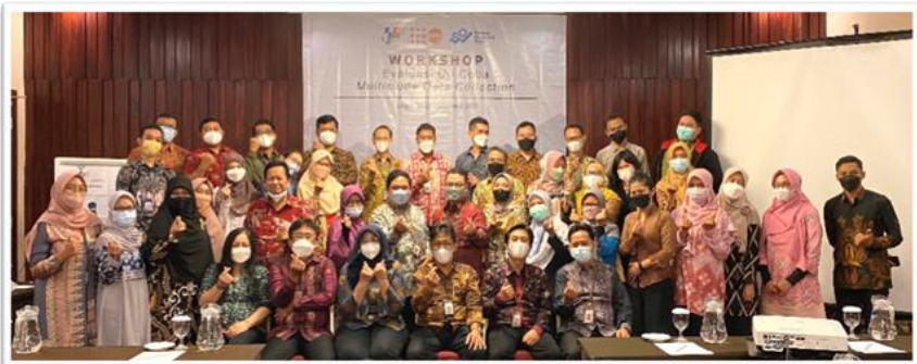
Peserta Workshop Evaluasi Uji Coba Multimode Data Collection LF SP2020

Workshop diikuti oleh peserta dari BPS Pusat termasuk JPT Madya dan Kepala BPS, perwakilan dari BPS Provinsi Sumatera Barat, BPS Provinsi DKI Jakarta, dan BPS Kabupaten Dharmasraya. Selain peserta dari BPS, workshop turut dihadiri oleh perwakilan dari UNFPA, Bappenas, dan narasumber dari Lembaga Demografi UI, CISSReC, dan Nielsen Research Indonesia.