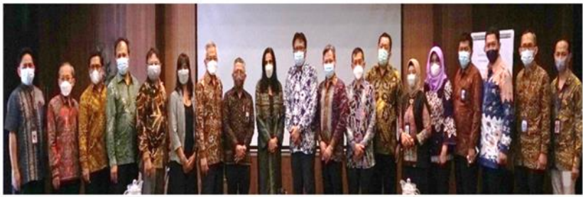
Pimpinan BPS Bersama Tamu Undangan Workshop Evaluasi Ujicoba Multimode Data Collection LF SP2020

Workshop Evaluasi Hasil Uji Coba Multimode Data Collection dilaksanakan di Bogor, pada tanggal 23-27 November 2021. Tujuan workshop adalah untuk mengevaluasi dan membahas berbagai persoalan terkait persiapan Long Form SP2020 Tahun 2022. Pembahasan dipecah sesuai tahapan GSBPM, yaitu finalisasi rancangan kegiatan ( design ) Long Form SP2020 yang mencakup rancangan pada tahapan build , collect , process , dan analyze-disseminate .